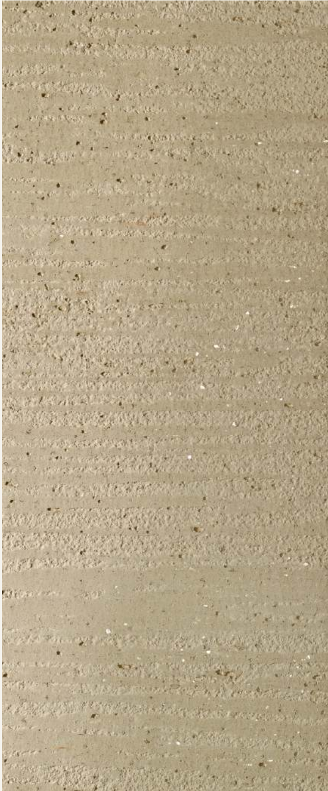
TEODORICO TDS 19206 & CERA WAX PLUS (dilution 1:1) - TRAVERTINE EFFECT