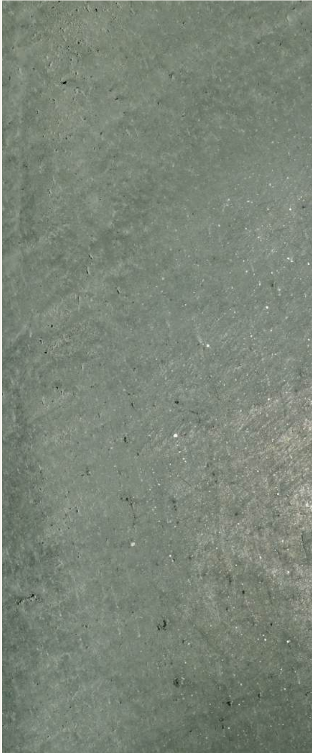
TEODORICO TD 19200 & CERA WAX PLUS (dilution 1:1)